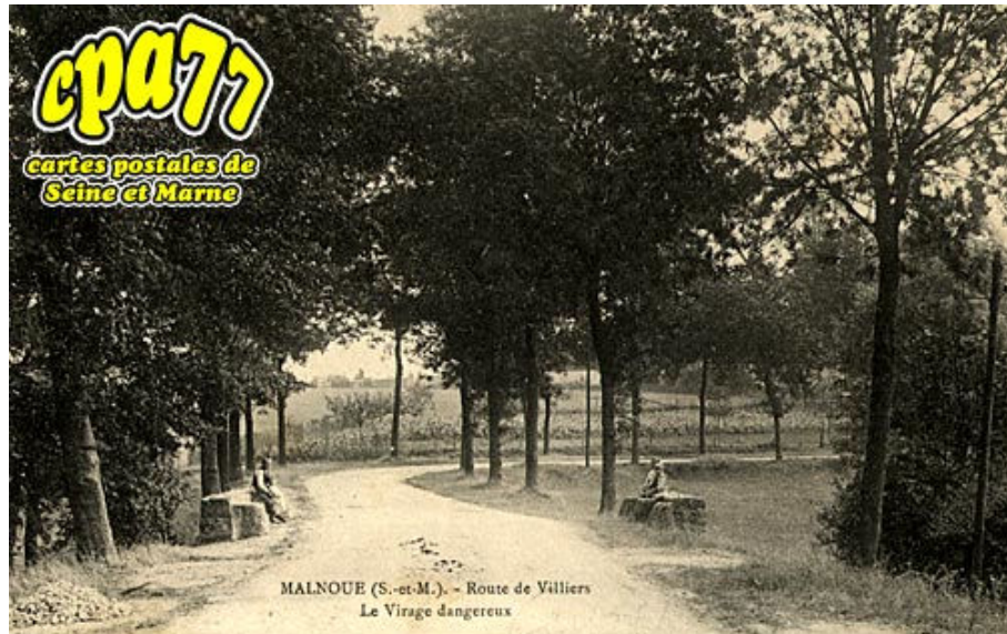
MALNOUE (S.-et-M.). - Route de Villiers Le Virage dangereux