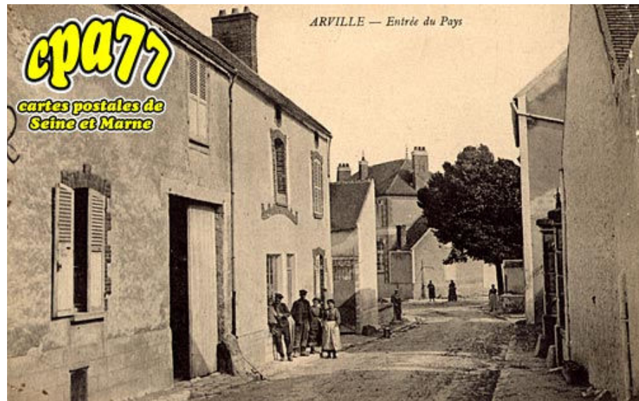
Entrée du Pays (en l'état)