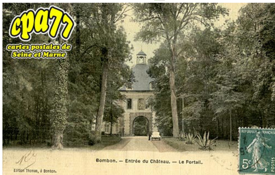
L'Entrée du Château - Le Portail