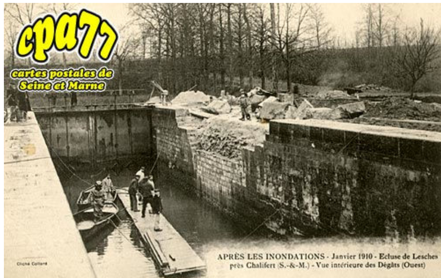
Après les inondations - Janvier 1910 - Ecluse de Lesches près Chalifert - Vue intérieure des Dégâts (Ouest)