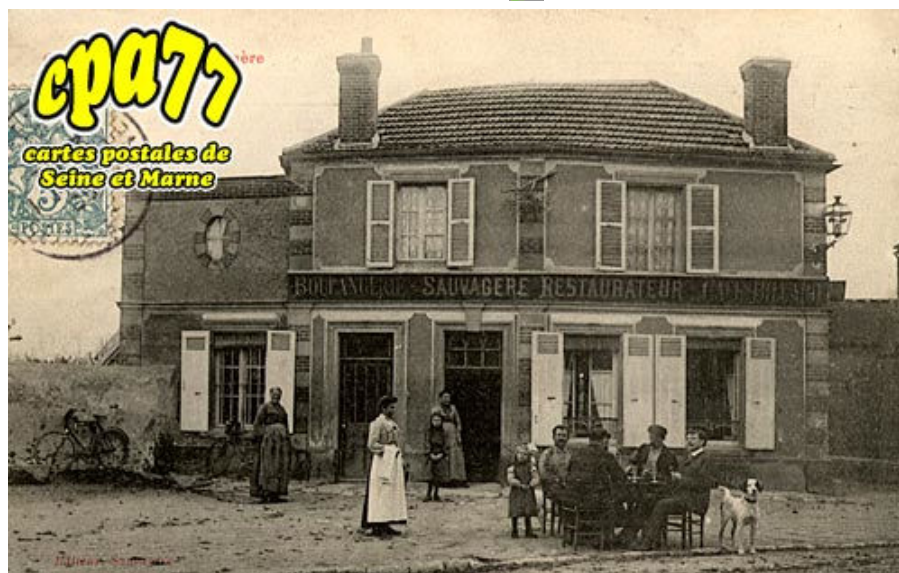
Café - Restaurant Sauvagère

Carte virtuelle : gratuite Original : 58.75 €