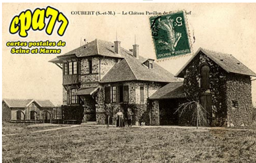
Le Château Pavillon du Grand Chef