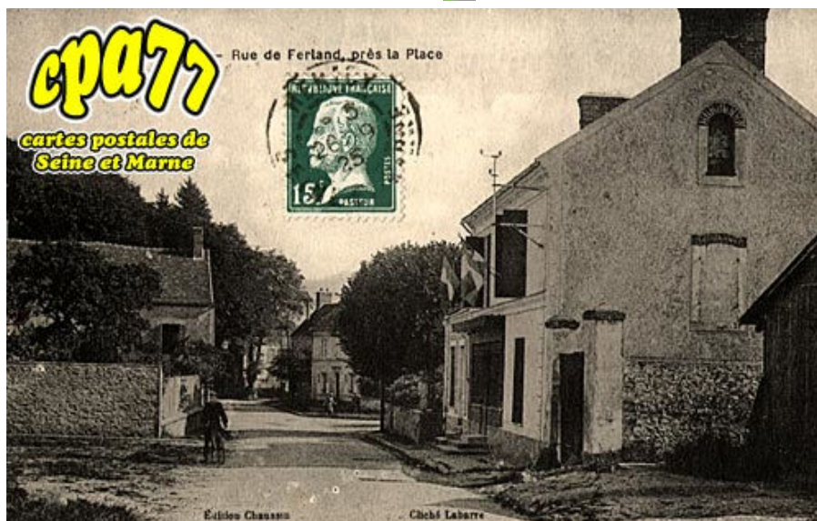
Rue de Ferland, près la Place