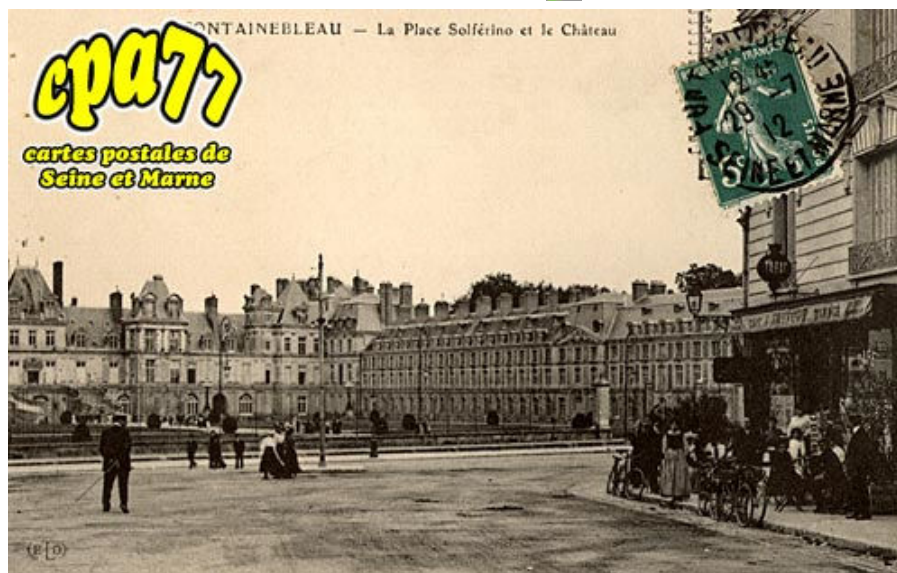
La Place Solférino et le Château