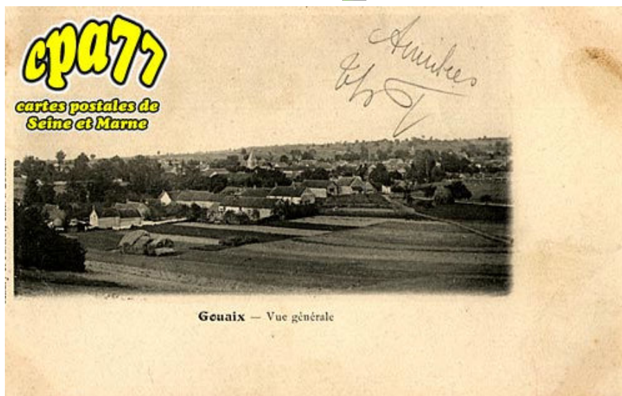
Gouaix — Vue générale