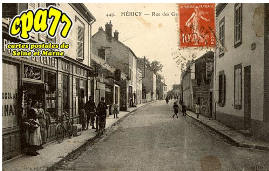
Rue des G (en l'état)