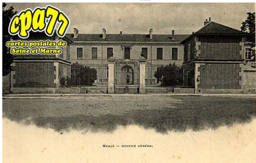
MEAUX - HOSPICE GÉNÉRAL