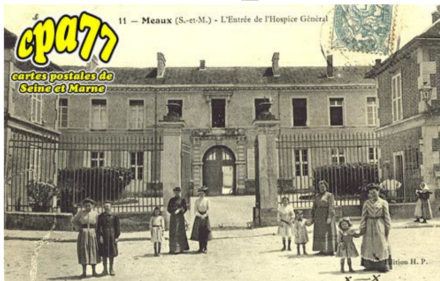
L'Entrée de l'hospice Général