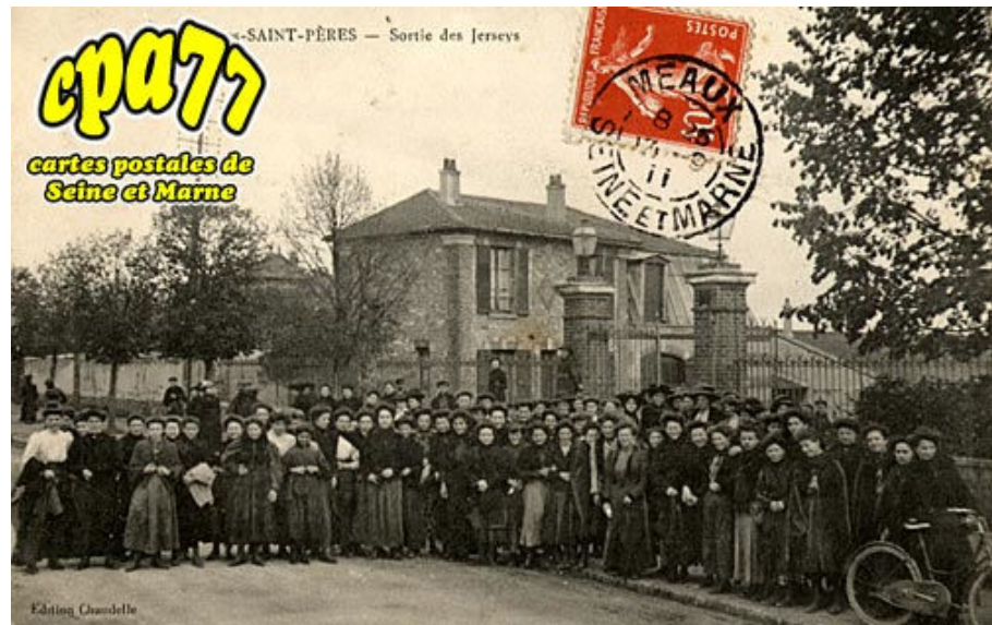
Les Saint-Pères - Sortie des Jerseys