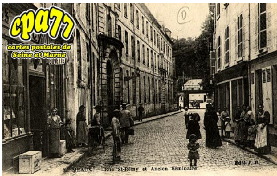
Rue Saint Rémy et Ancien Séminaire