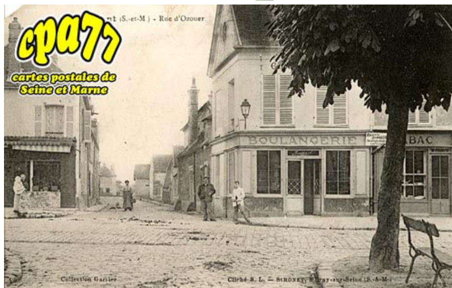
Rue d'Ozouer (en l'état)