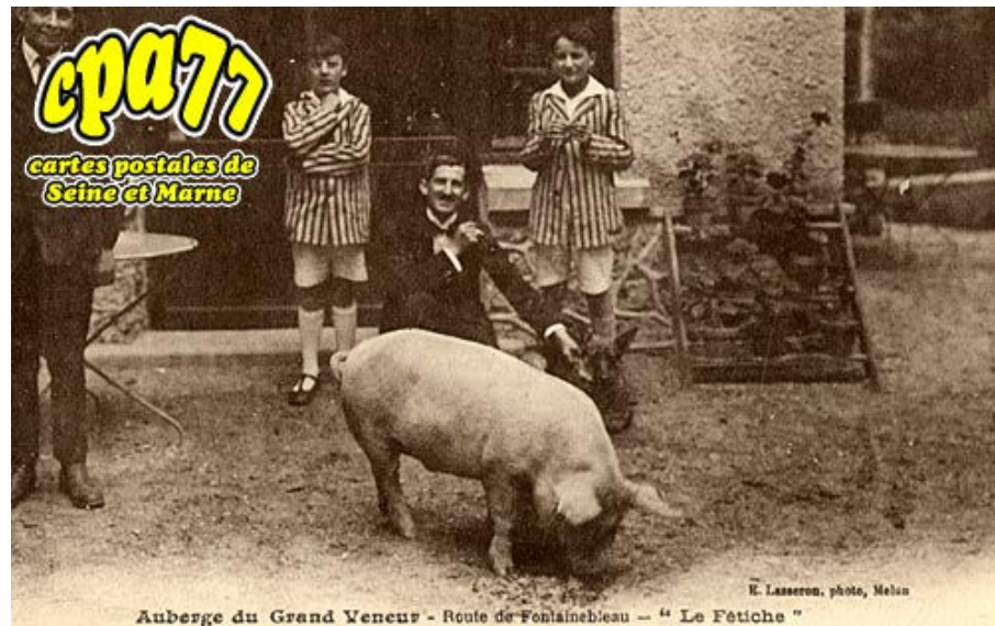
Auberge du Grand Veneur - Route de Fontainebleau - "La Fétiche"