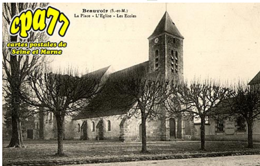
La Place - L'Eglise - Les Ecoles