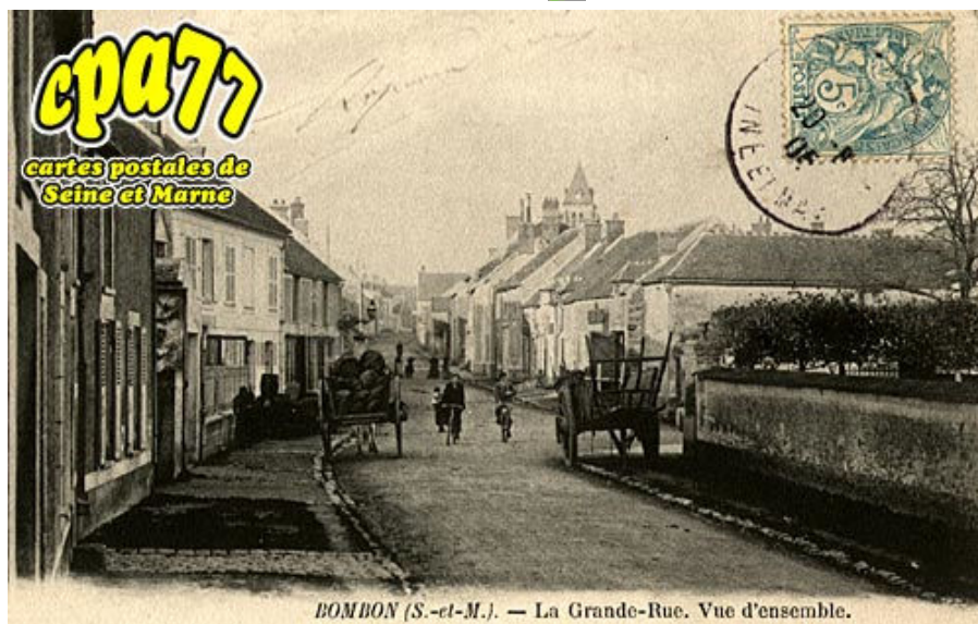
BOMBON (S.-et-M.). — La Grande-Rue. Vue d'ensemble.